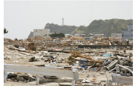
福島県いわき市。塩谷崎灯台が遠くに見えます。がれきもずいぶん撤去されてきていますが、まだまだです。