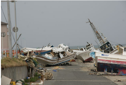
打ち上げられた漁船の数々。痛々しいです。

福島県の東端、太平洋に沿った浜通りの南東に位置し、東は太平洋に面し、60kmに渡る海岸線に、10箇所の海水浴場と小名浜港を初めとする11箇所の港を持つ。西は阿武隈高地に面し7割が山間部で、残る3割の平野部に市街地がある。JR常磐線では、トンネル、平野部、海岸線が交互に現れる。